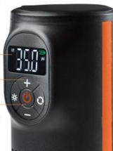
Product Info Graphics

Easy to read digital display Four programmable pressure settings Digital auto stop for precise inflation Pressure unit options Psi, BAR and kPa