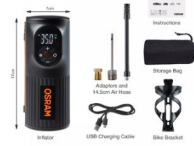
Product Info Graphics